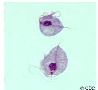
Dos parásitos Trichomonas vaginalis , amplificados (observados a través del microscopio)

Las mujeres embarazadas que tienen tricomoniasis son más propensas a tener sus bebés antes de tiempo (parto prematuro). Además, los bebés nacidos de madres infectadas tienen más probabilidades de tener bajo peso al nacer, según los parámetros oficiales (menos de 5.5 libras).